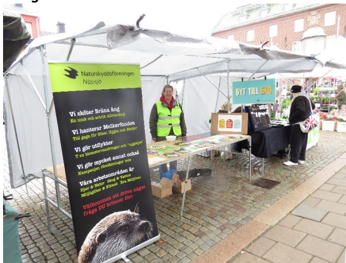
Bilden är från 2014, men 2015 var liknande.

För att göra "mera" av MVV behövs ytterligare engagerade människor och kanske nya infallsvinklar. I år var temat "Ekologiskt". Detta tema återkommer nästa år och en möjlig tanke är att man i kombination med en fortsättning på Kemikalieprojektet skulle kunna få tyngd att påverka kommunens inköspolicy.