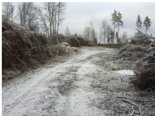
Fagertofta strax före jul 2015

Både kommunen och Södra Skogsägarna har aktivt sökt samarbete med föreningen, och styrelsen ser en positiv möjlighet till dialog och utveckling av samarbetet inom t.ex. skogsinformation, gemensamma utflykter etc.